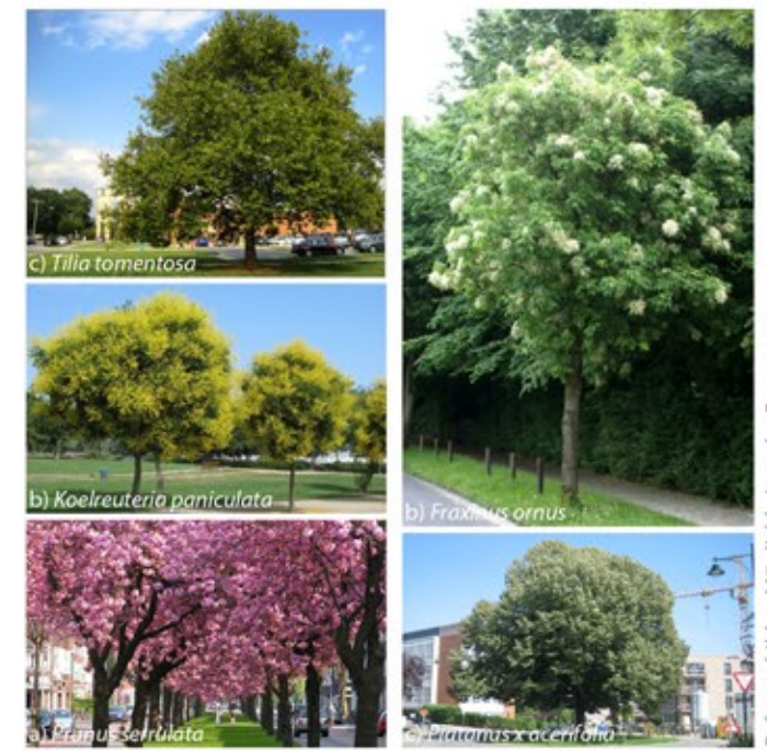
Referenzbilder-Möglichkeiten der Baumarten